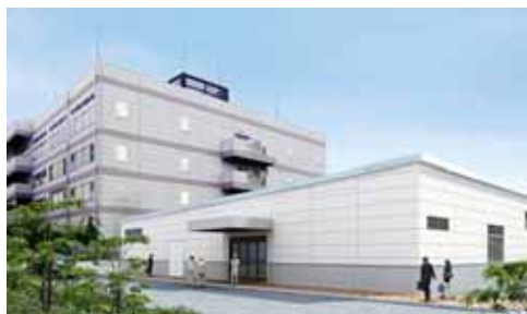
专用工厂的示意图