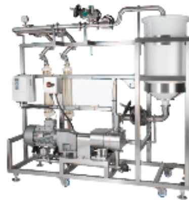
脂质体量产设备 效果图